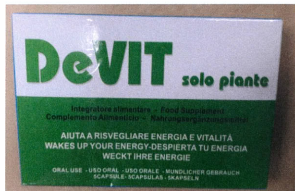
Fig.5: Imagen del producto DEVIT SOLO PIANTE CÁPSULAS.