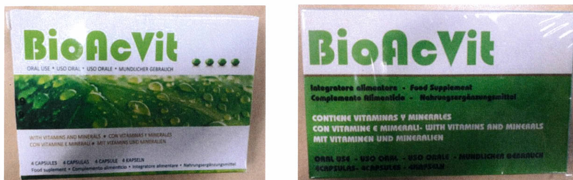
Fig.1: Imágenes del producto BIOACVIT CÁPSULAS .

La información, permanentemente actualizada, de todos los medicamentos autorizados y controlados por la AEMPS está disponible en la web de la Agencia, www.aemps.gob.es , dentro del apartado Centro de Información online de Medicamentos Autorizados (CIMA) .