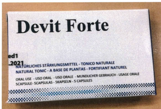
Fig.4: Imagen del producto DEVIT FORTE CÁPSULAS.