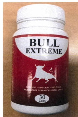
Fig.6: Imágenes del producto BULL EXTREME CÁPSULAS.