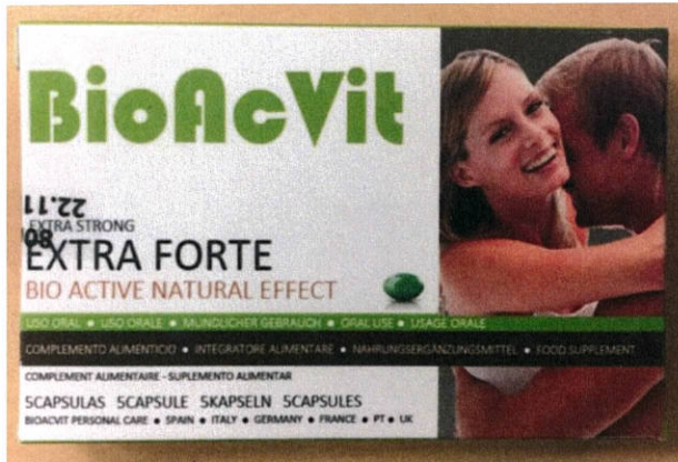
Fig.2: Imagen del producto BIOACVIT EXTRA FORTE CÁPSULAS.